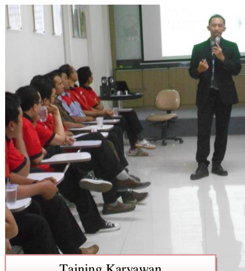
Taining Karyawan BP3S SURABAYA