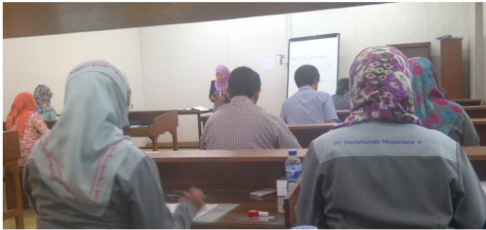
Psikotes Evaluasi dan Promosi Karyawan PT. PERKEBUNAN NUSANTARA X JEMBER