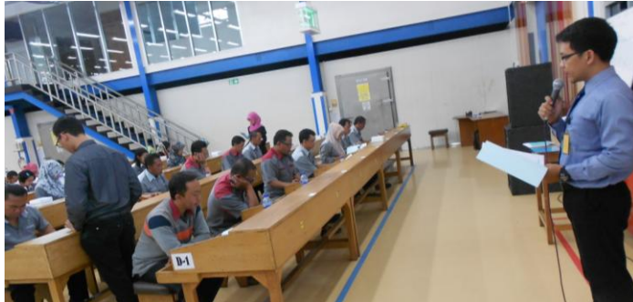
Psikotes Seleksi Karyawan PT. BANK PEMBANGUNAN DAERAH (JABAR dan BANTEN)